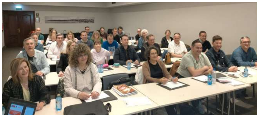
GIJON 21 Y 22 DE MAYO