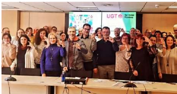
MADRID CIENCIA 12 Y 13 DE MARZO