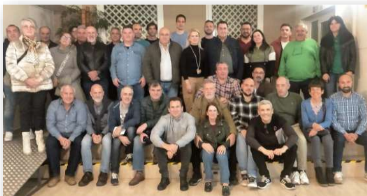
DEFENSA CORDOBA 6 Y 7 DE MARZO